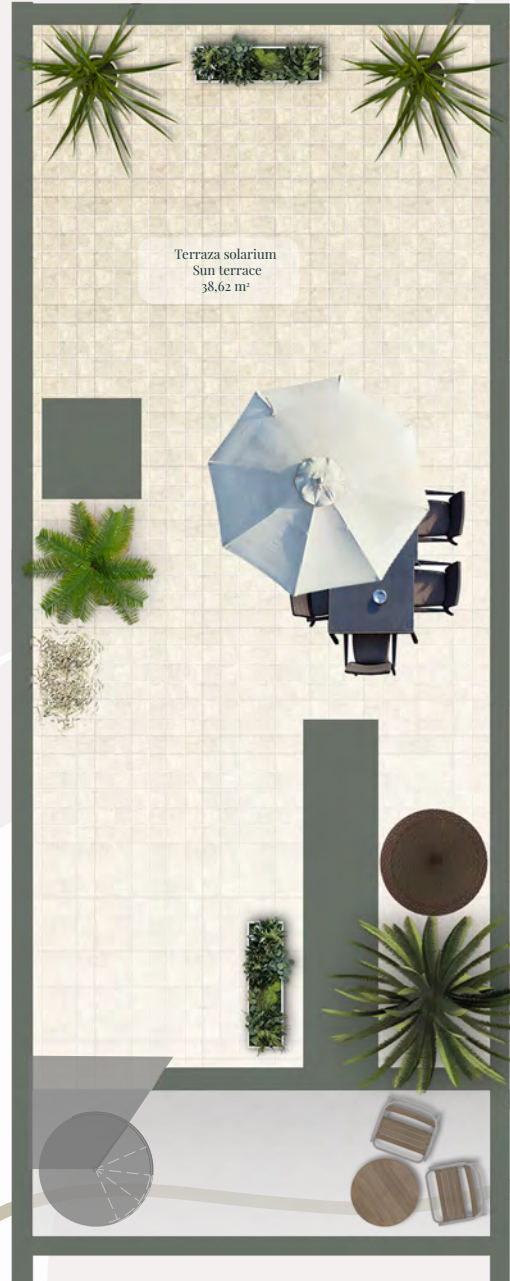
PLANTA CUBIERTA Rooftop